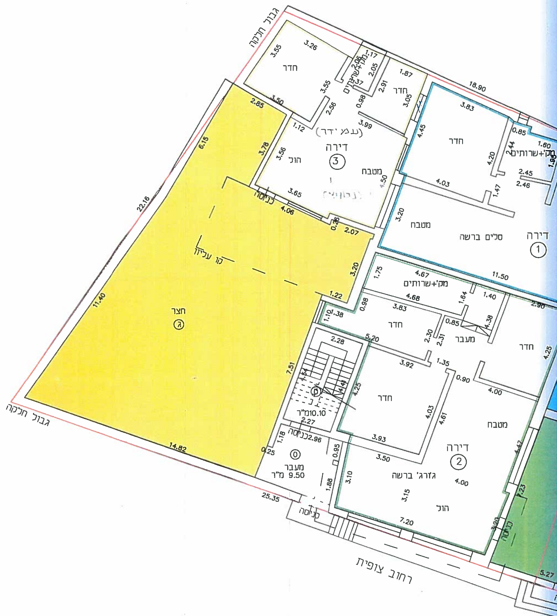
ת קומת קרקע קנ"מ 1:100